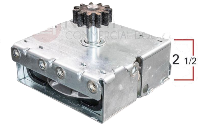
MECANISMO DE 6 1/2" DE ANCHO POR 6" DE ALTO POR 2 1/2" DE FONDO.