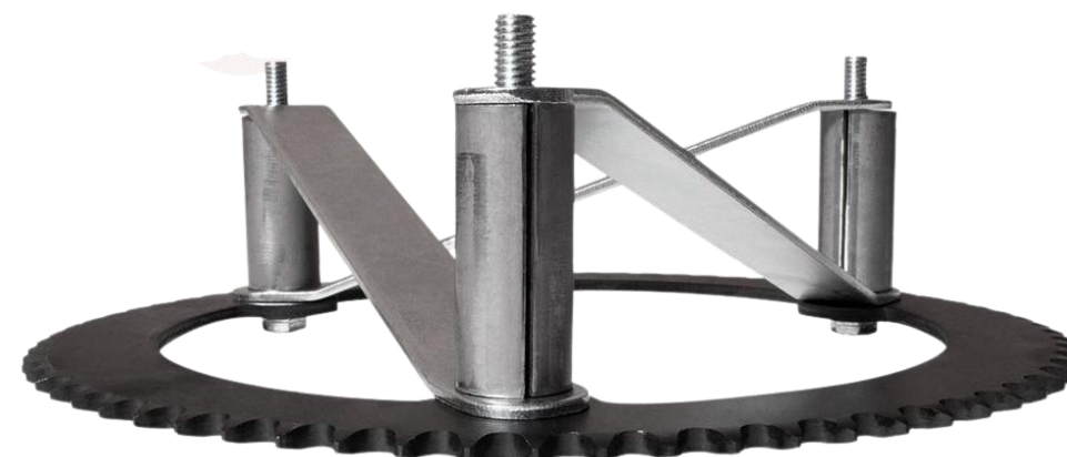
VISTA DEL KIT ARMADO*