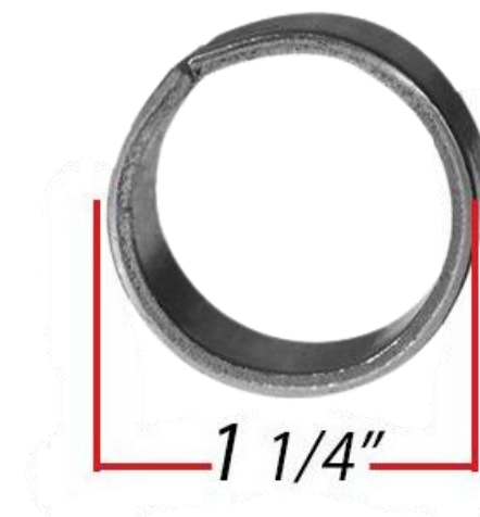
ESPACIADORES DE 1 1/4"