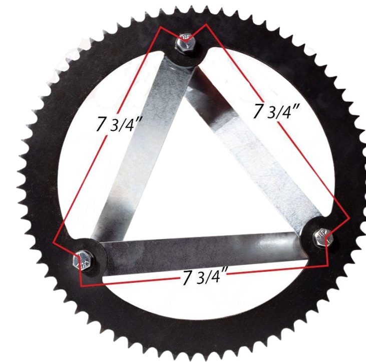
CREMALLERA DE ACERO DE 12"